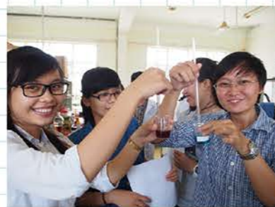
カント大学・ホーチミン理科大学(ベトナム)

海外に拠点を置く企業、海外の協定大学等研究機関の現場で実践的なプロジェクト遂行を体験し、国際的な視野を持つ人材育成を目的としたプログラムです。期間は原則2週間以上から1年以内、対象は原則として学部4年生および大学院生になります。KIT グローバル人材育成プログラムの奨学金への応募が可能です。