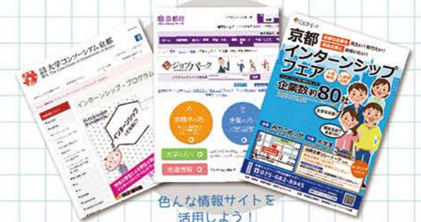
色々な情報サイトを 活用しよう!

学生は、左記の「大学が主導的に実施するインターンシップ」とは別に、一般的に、企業等が公募するインターンシップの内容や条件等の情報を収集し、希望する会社などに申込みを行い、受入が決まれば参加することができます。(本学、大学コンソーシアム京都、京都府のジョスパークなどが斡旋するインターンシップもこれに含まれます。)