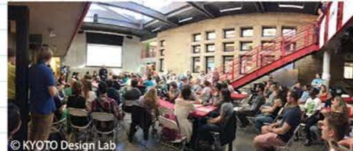
ME310: グローバルイノベーションプログラム (スタンフォード大学でのワークショップ)