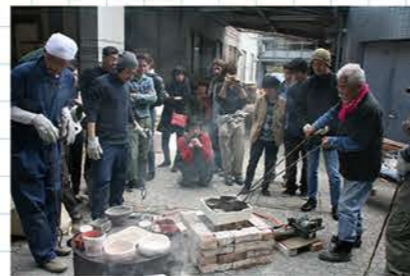
京の伝統工芸-技と美 陶芸実習(野焼き)

これらの授業は、科目名に“インターンシップ”という文言はないものの実質的にはインターンシップを取り込んで実施している科目です。