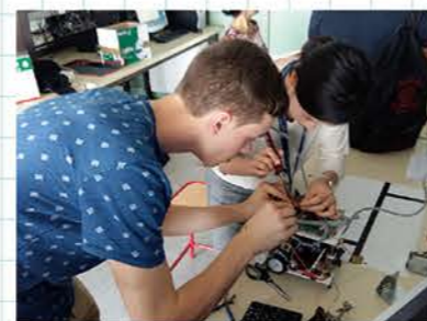
ポリテク・オルレアン(フランス)