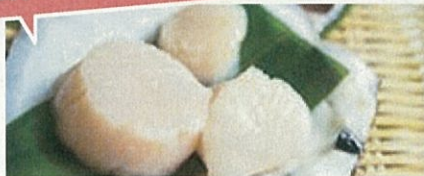
有限会社ヤマキイチ商店 (釜石市) 日本一高いホタテで三陸の水産市場を盛り起こせ!