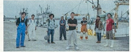
フィッシャーマン・ジャパン (石巻市) ようこそ海へ。漁業に革命をおこすトップランナーと過ごす夏