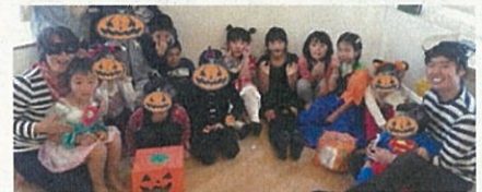
株式会社dreamLab (いわき市) ワクワクドキドキが好きな人、待ってます!