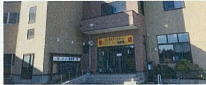
ニュー泊崎荘 (南三陸町) 減災×循環型のまちづくりを体感できるツアープランを開発しよう!