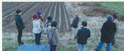
一般社団法人 イシノマキ・ファーム (石巻市) 有機無農薬栽培について学びながら地域の農業の現状を徹底リサーチ