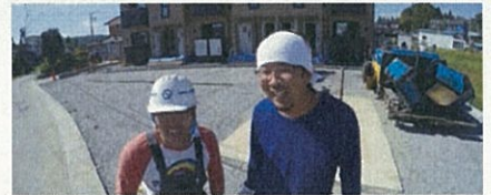
株式会社菅原工業 (気仙沼市) 建設業のイメージ革新を目指す情報発信プロジェクト