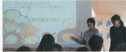
株式会社オーテック (女川町) 女川から将来のITベンチャーの卵を産みだせ!