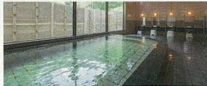
ロッツ株式会社 (陸前高田市) 客数倍増! 地域の特色満載ツアーで秘境温泉に人を呼び込め!